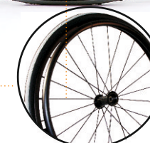
koło 24' , 22' standard