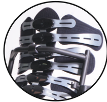
Orteza tułowa TARTA® stabilizuje, odciąża kręgosłup. Przy deformacjach nieutralonych - koryguje wady.