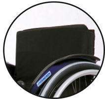
oparcie bez rączek standard