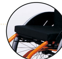
B28-standardowa poduszka z gąbki-opcja