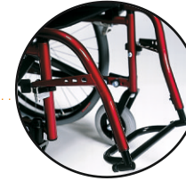
zagięte do środka, poprzeczka-standard