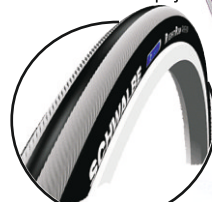
opona Right Run Schwalbe do kół 22',24' -standard