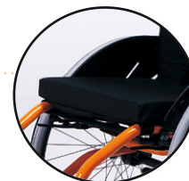
B28-standardowa poduszka z gąbki-opcja