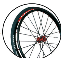
koło VIKING 24' opcja