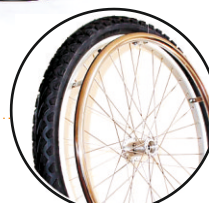
koło 24'x2 off road-opcja