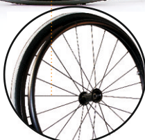
koło 24' , 22' standard