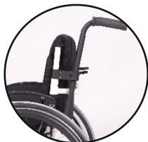
regulowane płynnie rączki-opcja