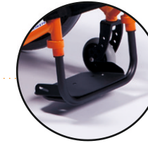
aluminiowa płyta na poprzeczce-opcja