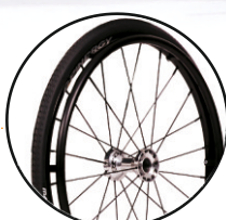
koło SPINERGY 24' opcja