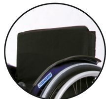
oparcie bez rączek standard