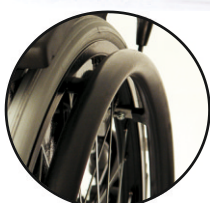
obřęcze napędowe żelowane