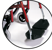
dzielone płyty podnóżków