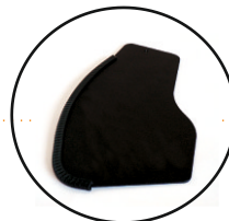
B82-prosta płyta boczna standard