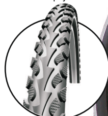
opona Land cruiser Schwalbe-off road na koło 24x2'-opcja