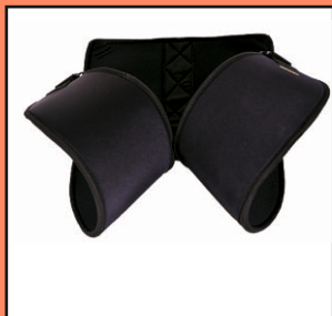
U01 NEO - uprzęż na miednicę, odwodząca z neoprenu