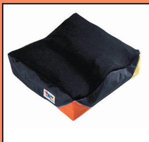
VICAIR® Vector - poduszka przeciw-odleżynowo stabilizacyjna