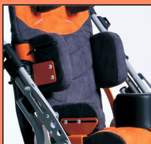
Peloty piersiowe umożliwiające bardziej precyzyjne ustawienie