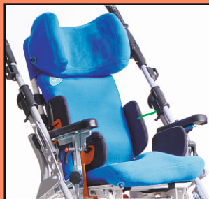
STABILO- siedzisko, oparcie, zagłówek -można zamawiać oddzielnie