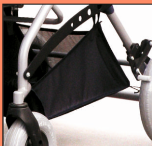
U61-siatka pod wózkiem