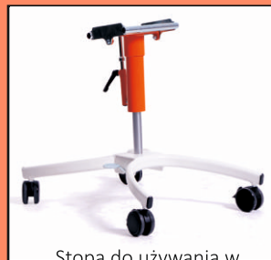
Stoпа do używania w mieszkaniu jako fotelik terapeutyczny