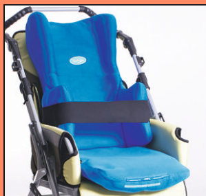
STABILO COMFORTABLE DUO Plus - gorset do stabilizacji dziecka