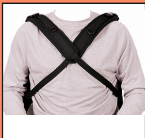
U78 NEO - pasy stabilizujące tułów