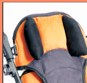
elastyczne podparcie głowy