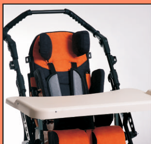
U63 - stolik terapeutyczny.