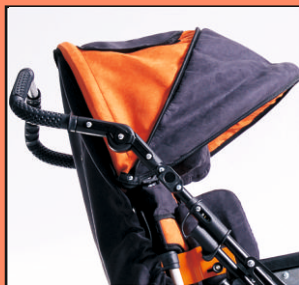
U67 - daszek