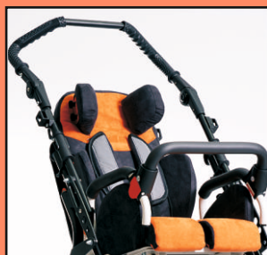
U64 - Barierka