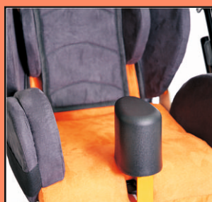
B28- dodatkowe poduszki