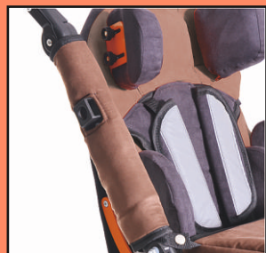
Ośłona na ramę