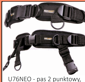
U76NEO - pas 2 punktowy, U75NEO - pas 4 punktowy z neoprenu, z trzema niezależnymi regulacjami