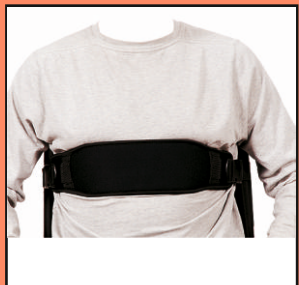
U80 NEO- szeroki pas piersiowy neoprenowy