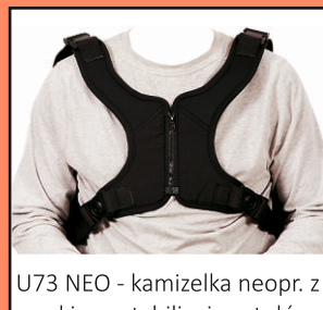
U73 NEO - kamizelka neopr. z zamkiem, stabilizująca tułów U74 NEO - kamizelka neopr. bez zamka, stabilizująca tułów