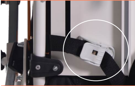
Praktyczne zaciśki pasków do stabilizacji.

Prawidłowe ułożenie dziecka w wózku to nie tylko komfort ale również poprawa takich funkcji jak trawienie i oddychanie. Gemini2 daje możliwość zmiany pozycji wszystkich ważnych części wózka: oparcia, siedziska i podnóżka niezależnie.