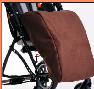
U62 - śpiwór