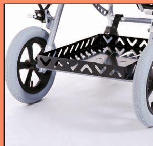
U70 - półka pod respirator