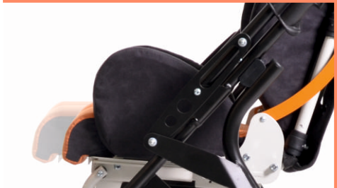
Regulacja głębokości siedziska.