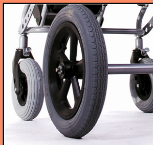
U68 - blokada kół przednich