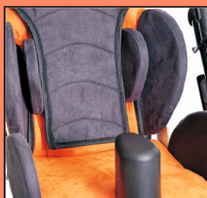
Dodatkowe pelotki tułowia