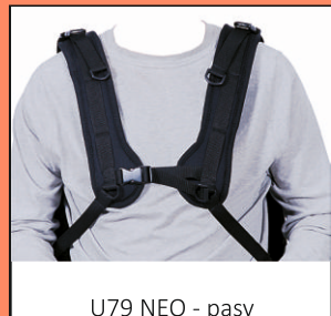
U79 NEO - pasy czteropunktowe neoprenowe do stabilizacji tułowia