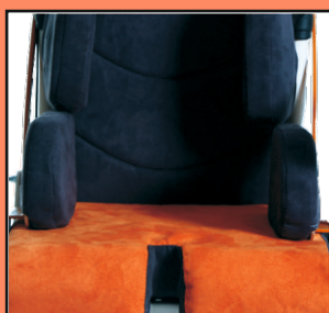
Peloty udowe umożliwiające bardziej precyzyjne ustawienie